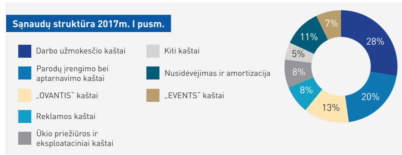
Pav. 2 Litexpo įmonių grupės išlaidų struktūra

Tiesioginiai parodų ir konferencijų bei renginių įrengimo kaštai 2017 metų pirmąjį pusmetį didėjo 14%. Lyginant su 2016 metų analogišku laikotarpiu išaugo ir pajamos, todėl grynoji apyvarta išliko beveik nepakitusi. Labiausiai tiesioginių kaštų srityje dėl didėjančių parodų apimčių augo papildomo personalo išlaidos bei kitos tiesioginės išlaidos, tačiau mažėjo įrangos nuomos, bei tiesioginės reklamos išlaidos. Litexpo Grupės pastovieji kaštai augo 9%. Nežymus išlaidų augimas buvo reklamos srityje (+4%), tiesioginių mokesčių srityje (+6%). Šiek tiek labiau augo dukterinės Litexpo įmonės „Litexpo Events“ kaštai (+19%), bei „Ovantis“ kaštai (+17%). Tuo tarpu eksploataciniai kaštai mažėjo (-4%). Litexpo įmonių grupės išlaidų struktūra pavaizduota žemiau esančiame grafike. (Pav. 2)